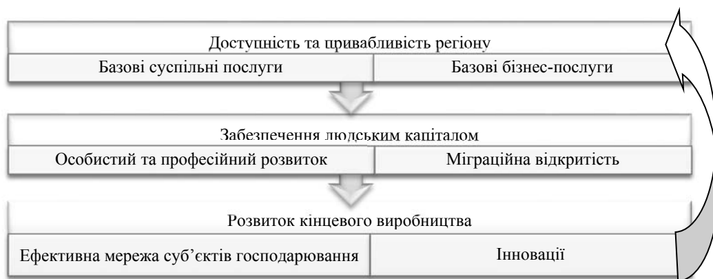
Рис. 1. Цикл створення доданої вартості регіонального розвитку

Результати. Для формування підходу у тлумаченні поняття конкурентоспроможності територіальних громад з прикладної точки зору проведемо аналогію з поняттям конкуренції у бізнесі. Основою для конкурентоспроможності підприємств є збільшення комплексних показників ефективності та показників додаткової вартості виробленої та реалізованої продукції [6]. Розвиток продуктивних секторів регіональних економік та підвищення їх конкурентоспроможності, що ґрунтується на функціонуванні замкненого циклу створення доданої вартості (рис. 1).