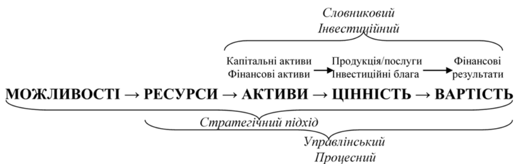
Рисунок 2. Підходи до формування об'єктного ланцюжка капіталоутворення на підприємстві

Узагальнюючи наведені визначення, об'єкти капіталоутворення можна розмістити у логічній послідовності, що формалізовано на рис. 2.