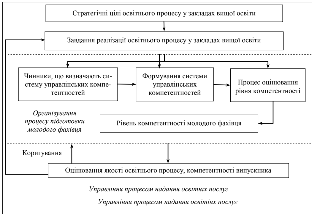
Рис. 2. Логіко-структурна модель управління процесом надання освітніх послуг згідно з компетентнісним підходом

ками і технологіями їх реалізації; якнайширше використання системного аналізу, що виражається в структуруванні аналізованих процесів і відповідному їх узгодженні, в результаті чого досягаються синергетичний і емерджентний ефекти [12].