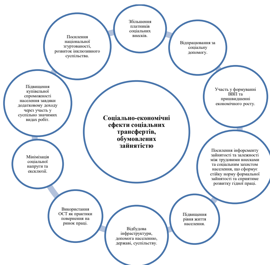
Рисунок 2. Соціально-економічні ефекти соціальних трансфертів, обумовлених зайнятістю